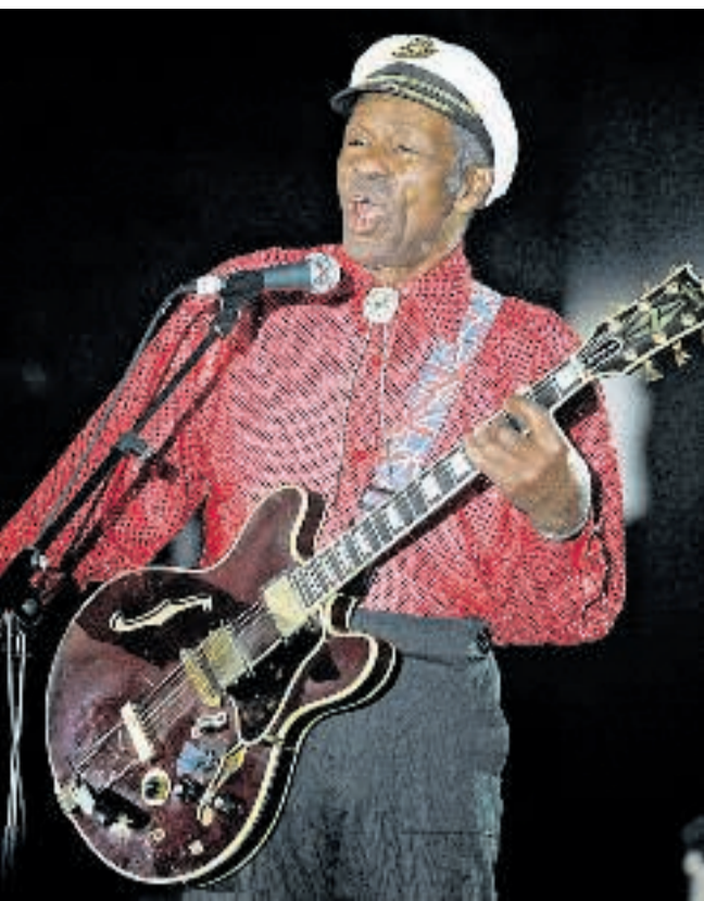
▲ Chuck Berry døde i lørdags, 90 år. Han har modtaget en Grammy for sit bidrag til musikhistorien, han blev i 2004 rangeret som nummer fire på en liste over verdens største rockmusikere, og flere af hans numre anses for at have været banebrydende for rockmusikken.