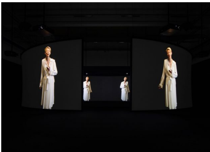
Doug Aitken: SONG 1 . Copenhagen Contemporary, 2018.

Mens Superflex' værk således vil for meget, kan det modsatte måske siges om det andet værk, den store og meget flotte videoinstallation Song 1 af den succesrige amerikanske kunstner Doug Aitken. Installationen er i denne version arrangeret som en ring af filmklæder, som man både kan se på udefra og indefra, siddende eller liggende på gulvet. De fleste vælger at kravle ind i ringen og lade sig omslutte. To projektioner ad gangen gentages hele vejen rundt.