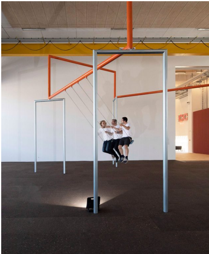
Superflex: One Two Three Swing! . Copenhagen Contemporary, 2018.

I det næste rum er anden halvdel af installationen, hvor en kæmpe, glat spejlkugle pendulerer frem og tilbage over et sindrigt designet tæppe i striber, der gradvist skifter kulør hen over gulvet. Når man nærmer sig den kæmpe pendulkugle, er den en smule faretruende; det føles som om, den vil kunne falde ned og knuse en. Men de fleste overvinder det og får øje på sig selv i den spejlblanke overflade. Mange ender med at lægge sig ned på gulvtæppet, ofte i en menneskecirkel med hovederne inderst, og kigge op på spejlingen af sig selv, de andre og rummet. Det er en herligt meditativ oplevelse, og jeg og min ledsager lå der i mindst en halv time ved åbningen og