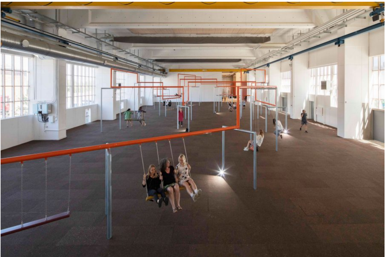
Superflex: One Two Three Swing! . Copenhagen Contemporary, 2018.

Anmeldelse 15 aug 2018 Af Torben Sangild