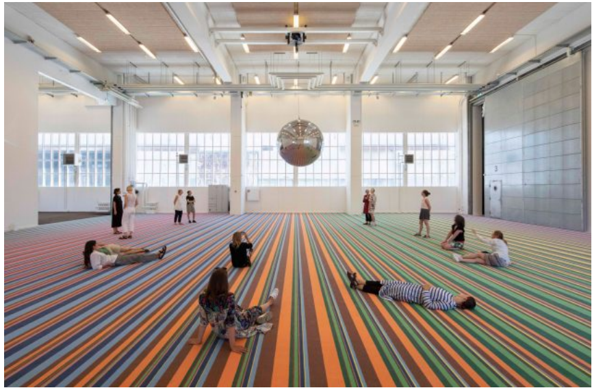
Superflex: One Two Three Swing! . Copenhagen Contemporary, 2018.

at gulvtæppet er lavet i eurosedlernes farver. Men alligevel. Jeg er ret sikker på, at det ikke er det, folk tænker på, når de ligger under kuglen.